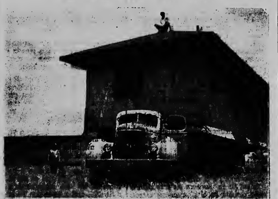
Dialuna riba no menos cu binti wiel duro nan a transporta e parti nobo di Protestants Militair Tehuis na Savaneta for di Lago. E homberson di Lago (cu a regala e cas aki completo na e tehuis) ya a yega di hasi sorto di trabounan asina caba mas biaha y pesel tambe sin mucho dificultad e transporte aki tambe a tuma lugar.